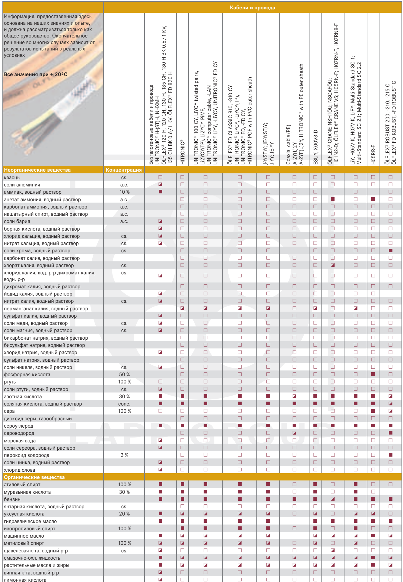
T1: Химическая стойкость наружных оболочек кабелей